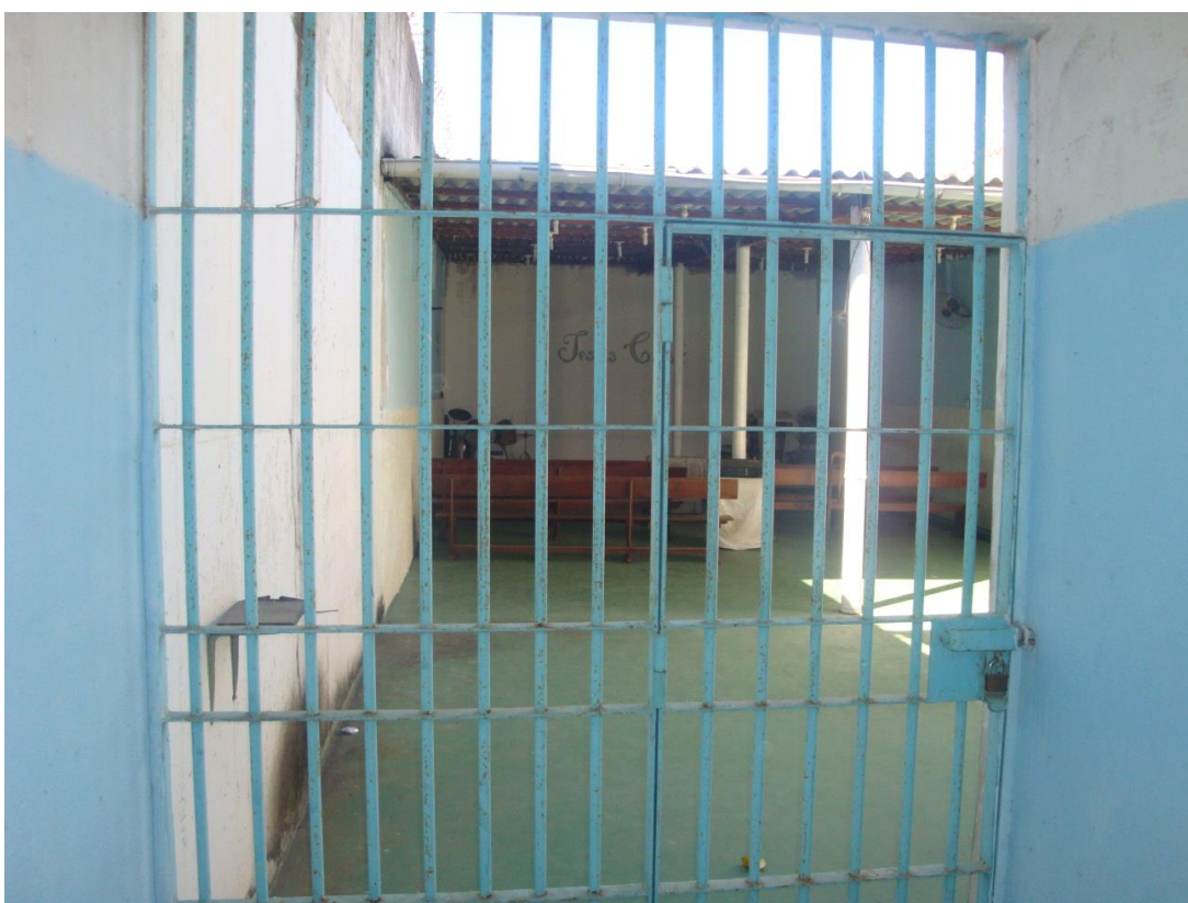
Espaço reservado para práticas religiosas

No pavilhão Seabra, vimos a igreja com 5 (cinco) bancos longos, som, bateria, ventiladores e com entrada por um espaço sem teto, o que dificulta um pouco o acesso nos dias de chuva. No extremo no pavilhão há um espaço denominado de barbearia, que até então estava desativada segundo a direção, em razão da periculosidade do antigo contingente carcerário.