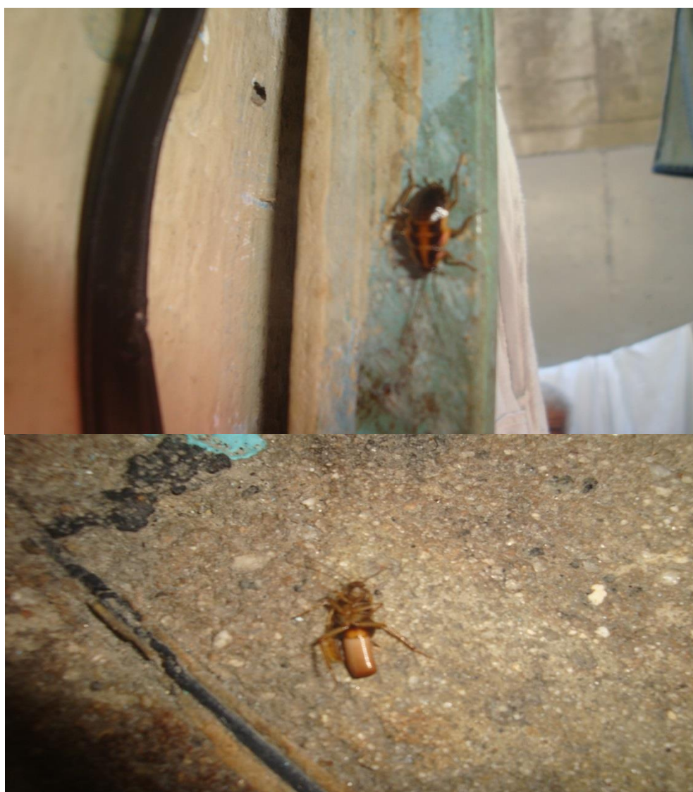
Alguns exemplos de baratas encontradas nas celas no dia da visita.

Diante de tal cenário, torna-se impraticável manter a higiene no interior das celas, dando vazão ao proliferamento de insetos indesejáveis e de doenças respiratórias e dermatológicas.