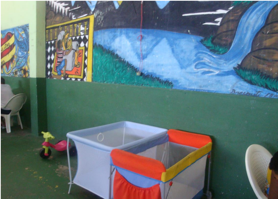
Pátio de Visita