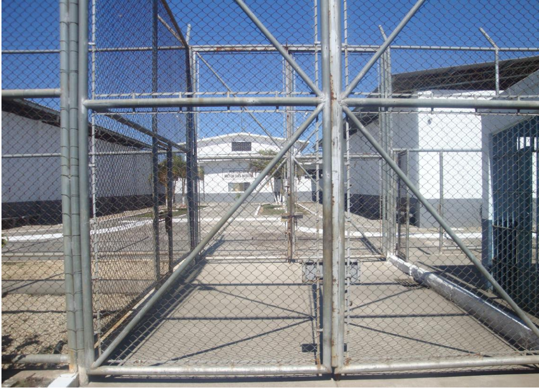
Portão de entrada e acesso ao pavilhão Meira Lima logo a seguir

Atravessando a sala da segurança se dá o pátio de visitas, um amplo espaço, com pinturas coloridas nas paredes, com muitas mesas e cadeiras plásticas, com banheiro feminino e outro masculino, e ainda com berços e brinquedos de crianças.