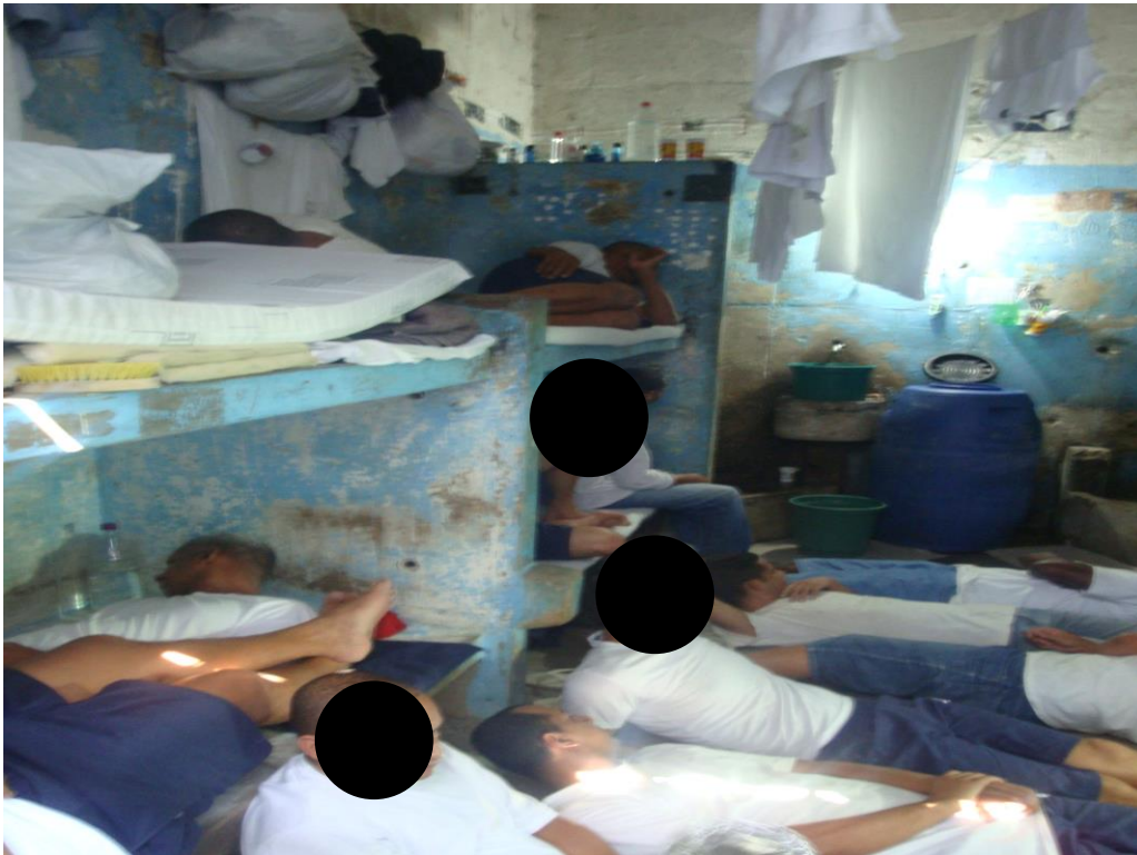
Presos simulando a hora de dormir.

A insalubridade das celas é gritante. O “banheiro” não está separado do restante das celas e é perto do “boi” que é estocada água (em baldes) que os presos irão consumir durante o período em que o registro de água estiver fechado.