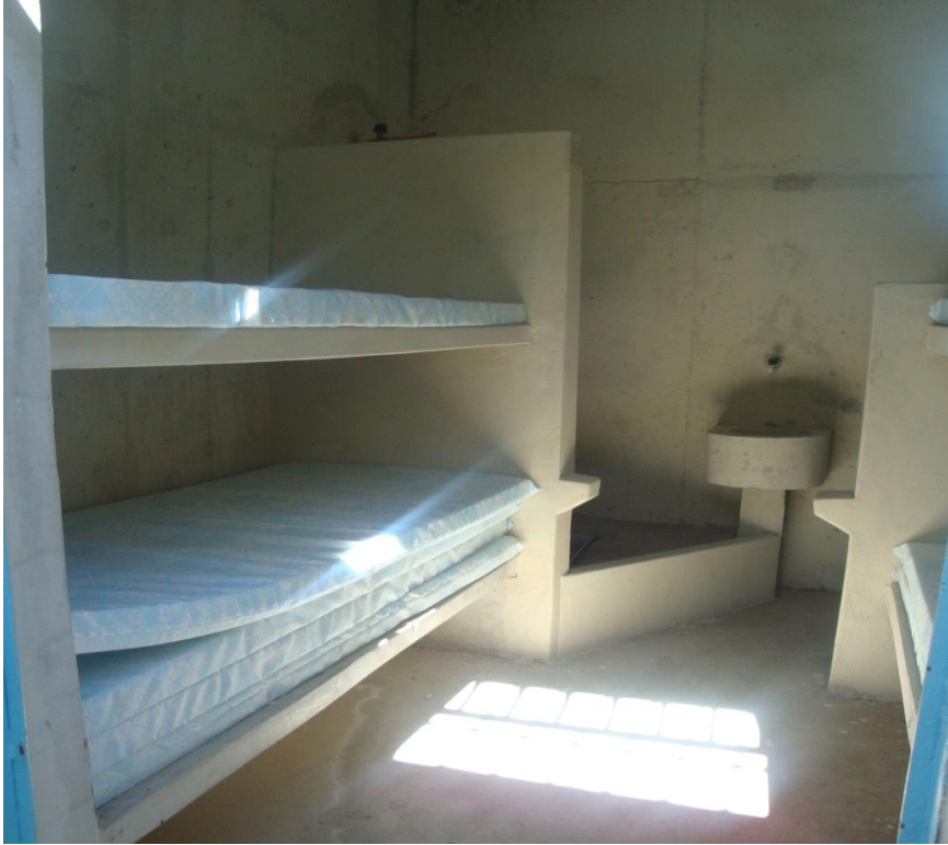
Cela da galeria dos idosos.