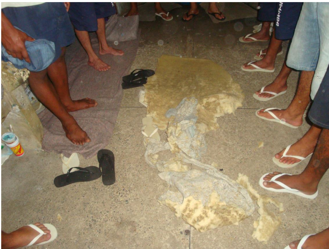
Foto de um dos colchões utilizado pelos presos.

Não há camas, assim como não há cobertores, nem colchões para todos os presos. E, ainda assim, os colchões que estão servindo aos presos estão velhos e em péssimo estado, alguns são apenas pedaços do que um dia já foi o que chamamos de colchão, conforme foto abaixo.