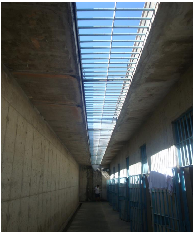
Corredor das galerias