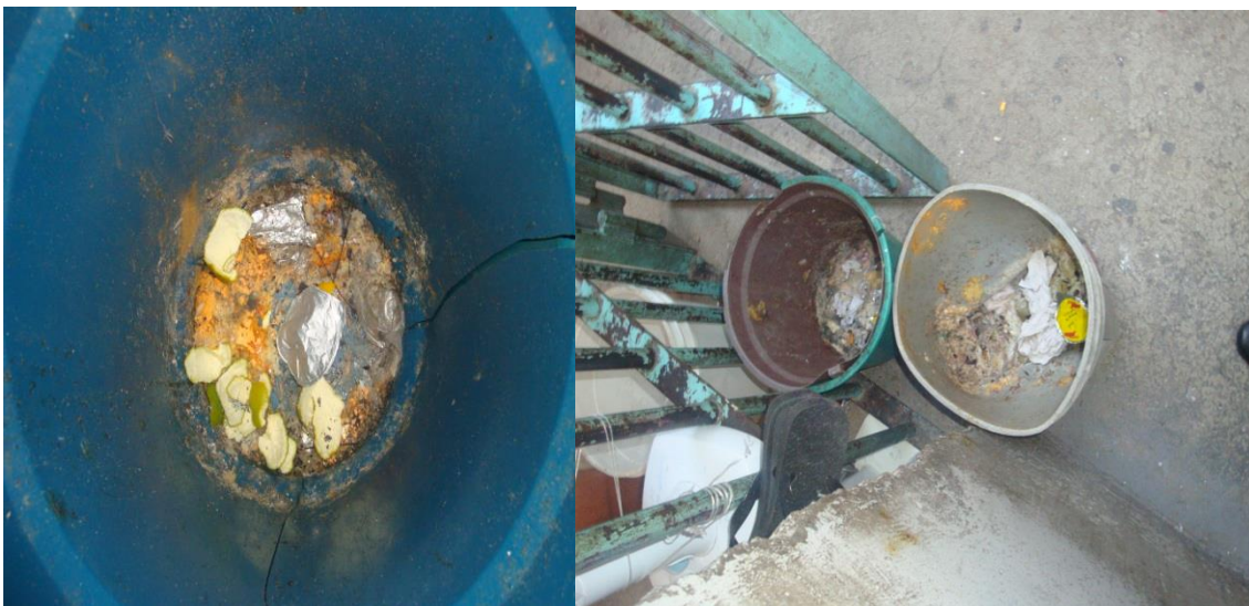
Baldes acumulando lixo encontrado em uma das galerias.

Há baldes que são usados como lixeiras, acumulando todo o tipo de material descartado e atraindo muitas moscas, mosquitos e baratas, além de contribuírem, juntamente com o mal cheiro do esgoto, na mistura de odores que formam o mau cheiro constante da unidade.