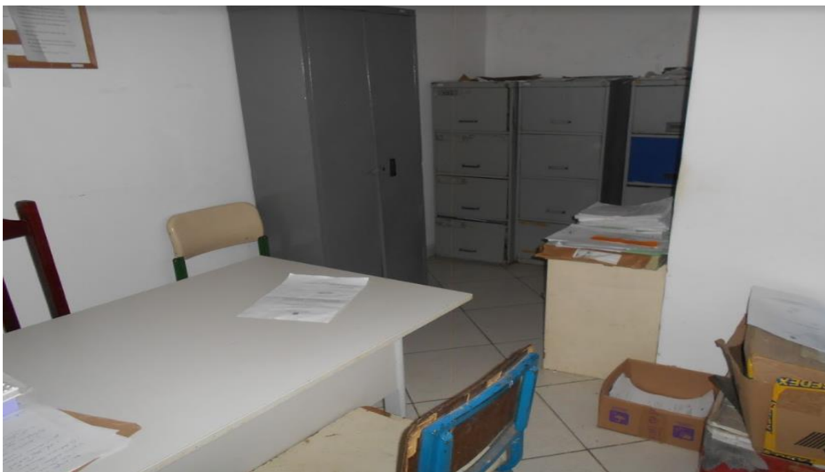
Sala da Assistência Social???