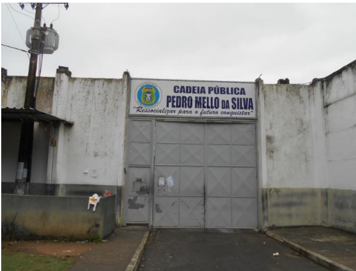
Porta de entrada da unidade prisional

portão de ferro. Entrando-se nesse portão de ferro tem-se acesso à portaria da unidade, onde fomos recepcionados e devidamente identificados antes de entrarmos nas demais dependências da unidade.