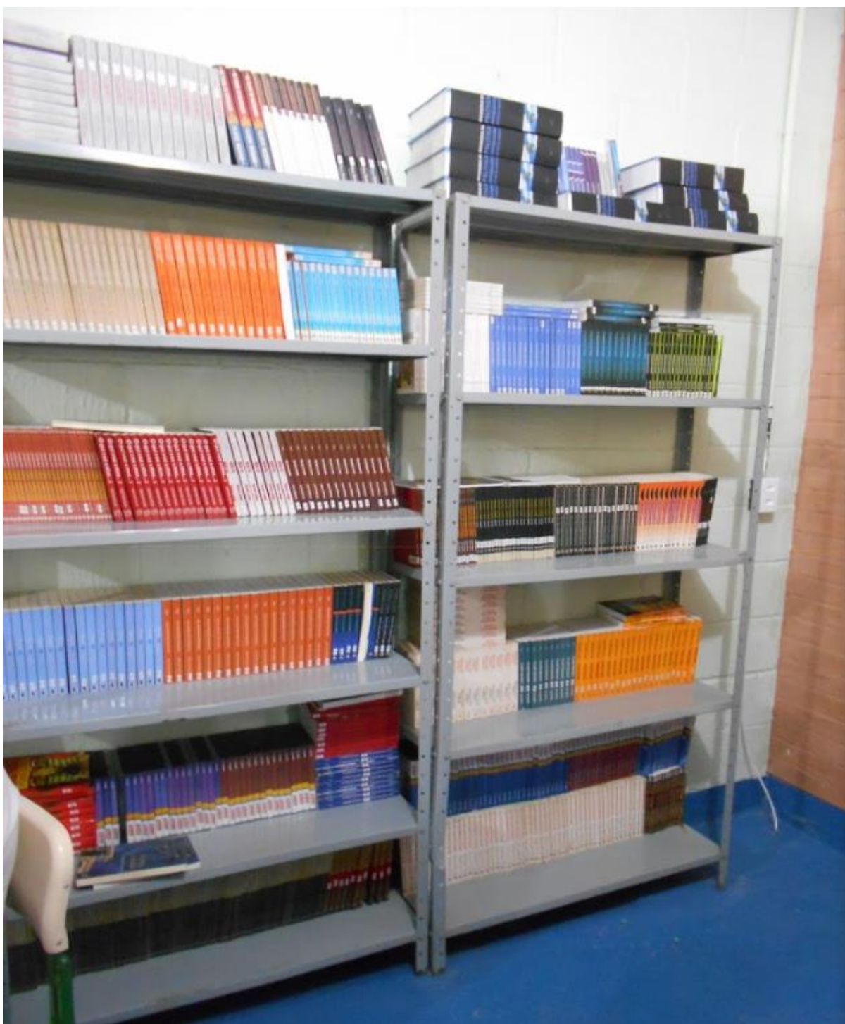
Fotos da biblioteca