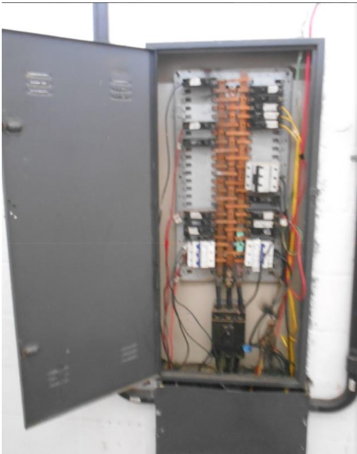
Quadro de eletricidade da unidade