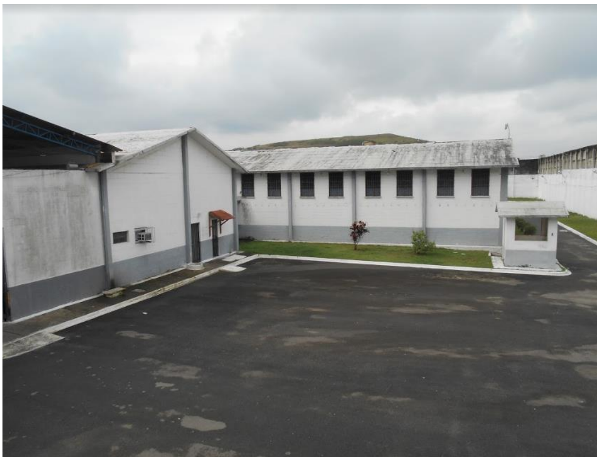
Visão da área ao redor da galeria principal da Unidade (2.)