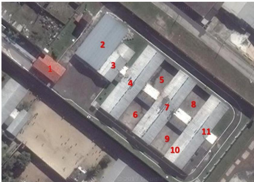
Imagem via satélite da unidade.

À frente do grande portão havia largo corredor que termina em outro portão de ferro que dá acesso ao edifício principal, onde ficam acautelados os internos. Na foto abaixo, retirada da ferramenta Google Earth 5 , consegue-se entender melhor esta estrutura; os números indicados aparecerão na descrição deste tópico.