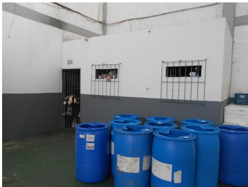
Visão exterior da cela destinada ao Isolamento.