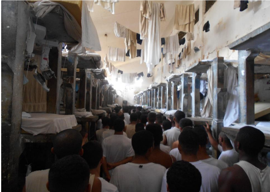
Imagem de uma cela coletiva que ilustra o quão sufocantes são os dias passados com tantos homens confinados neste espaço.