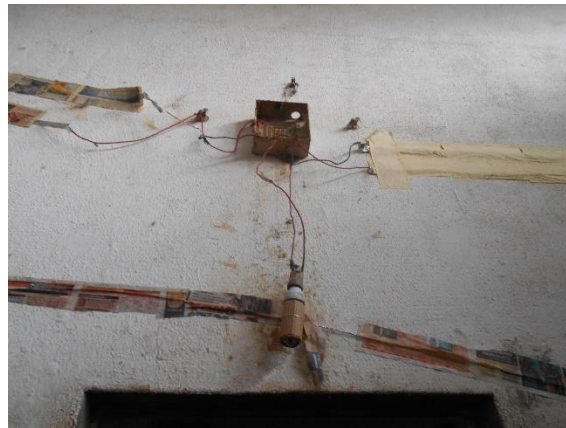
“Gambiarras elétricas, feitas com papelão e alumínio de quentinhas.