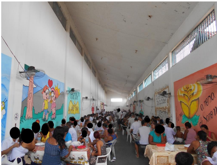
Espaço utilizado para visitas.