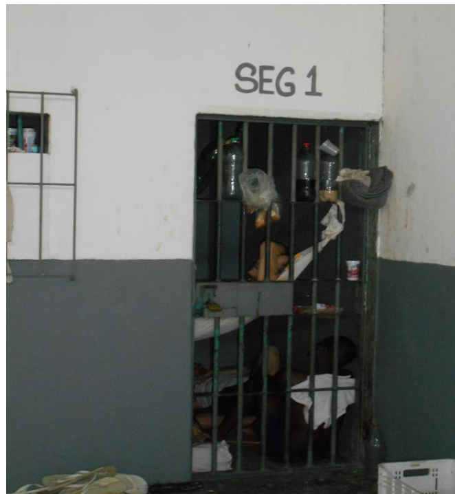
Vista externa da cela de seguro identificada como "SEG.1", o pequeno espaço era dividido por dezoito homens.