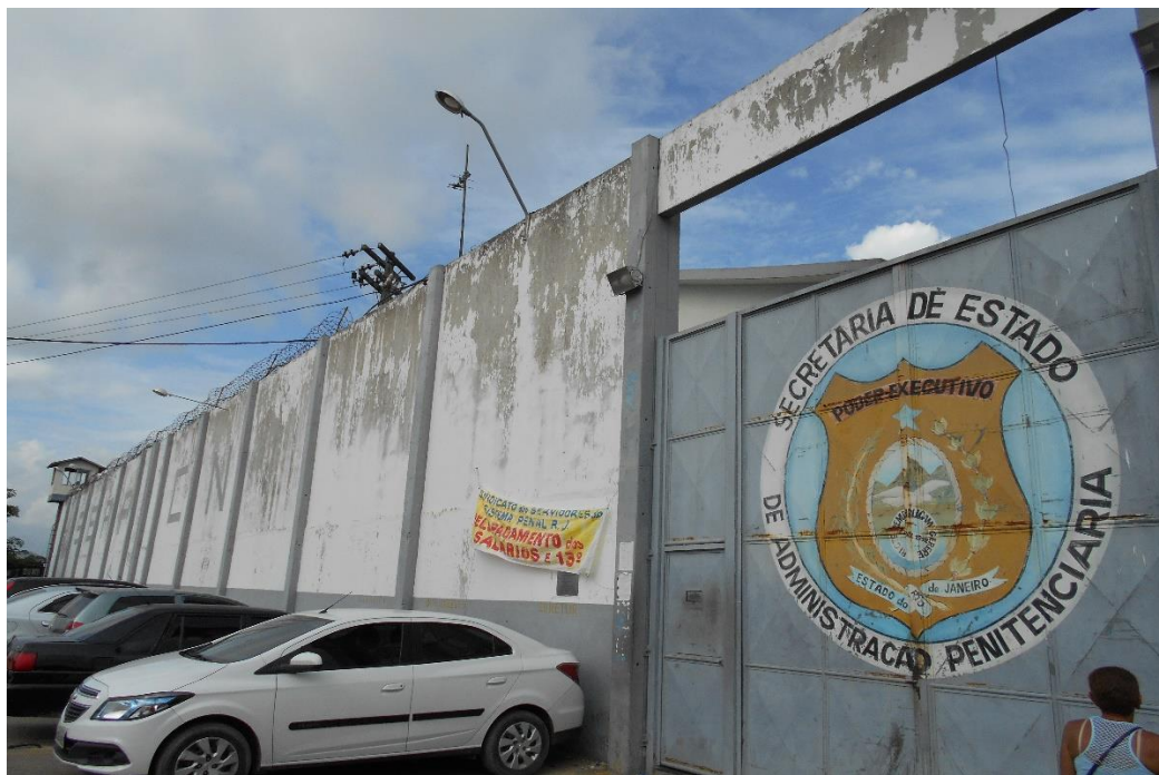
O portão principal que dá acesso à unidade.

materiais levados por eles aos presos são revistados. Nesse mesmo local fica o setor administrativo, a sala da Direção e alojamento dos servidores. Essa parte apresenta um regular estado de conservação. Após o segundo grande portão, chegamos na Unidade propriamente dita. Cercada pelos altos muros, à esquerda temos a entrada principal, a entrada do parlatório de advogados e a entrada do galpão, que originalmente deveria ser o espaço de visitas, porém funciona como o espaço que abriga as terríveis celas de seguro e isolamento, que serão tratadas em capítulos próprios. Entre este galpão e o pavilhão que abriga as dez celas da unidade, há uma antessala onde fica a Enfermaria e o Consultório que estão em regular estado de conservação.