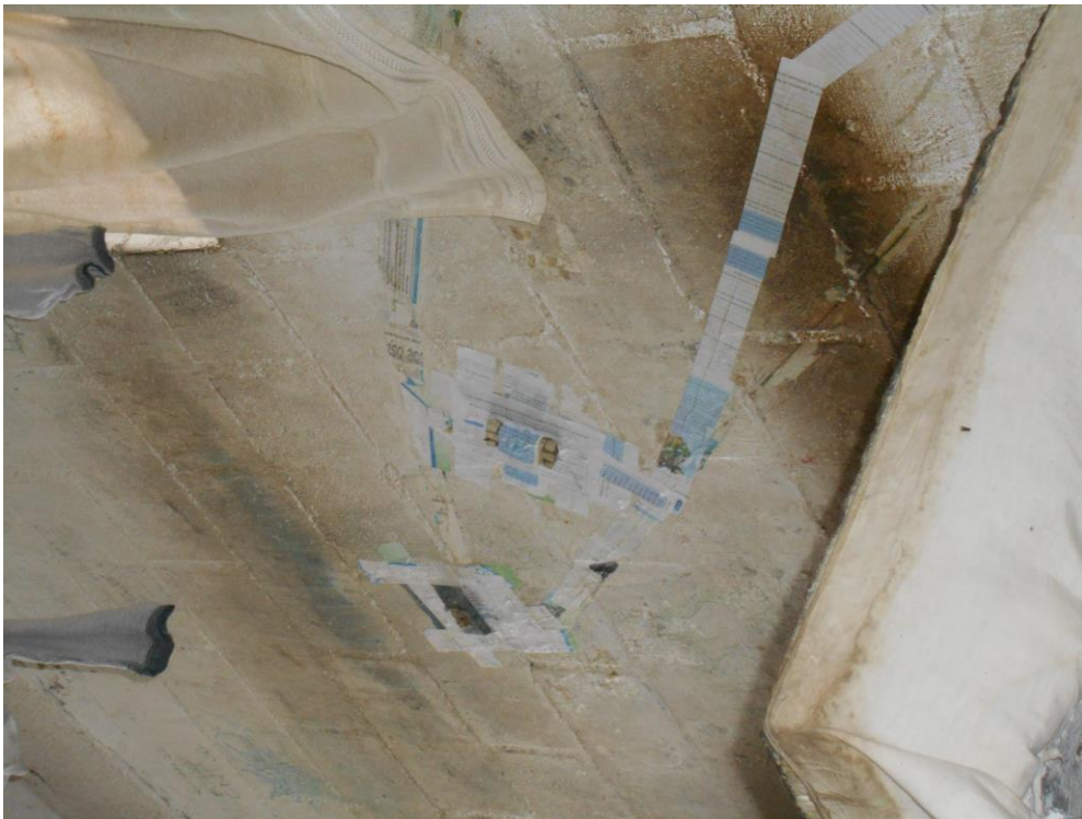
Instalações elétricas das celas coletivas.