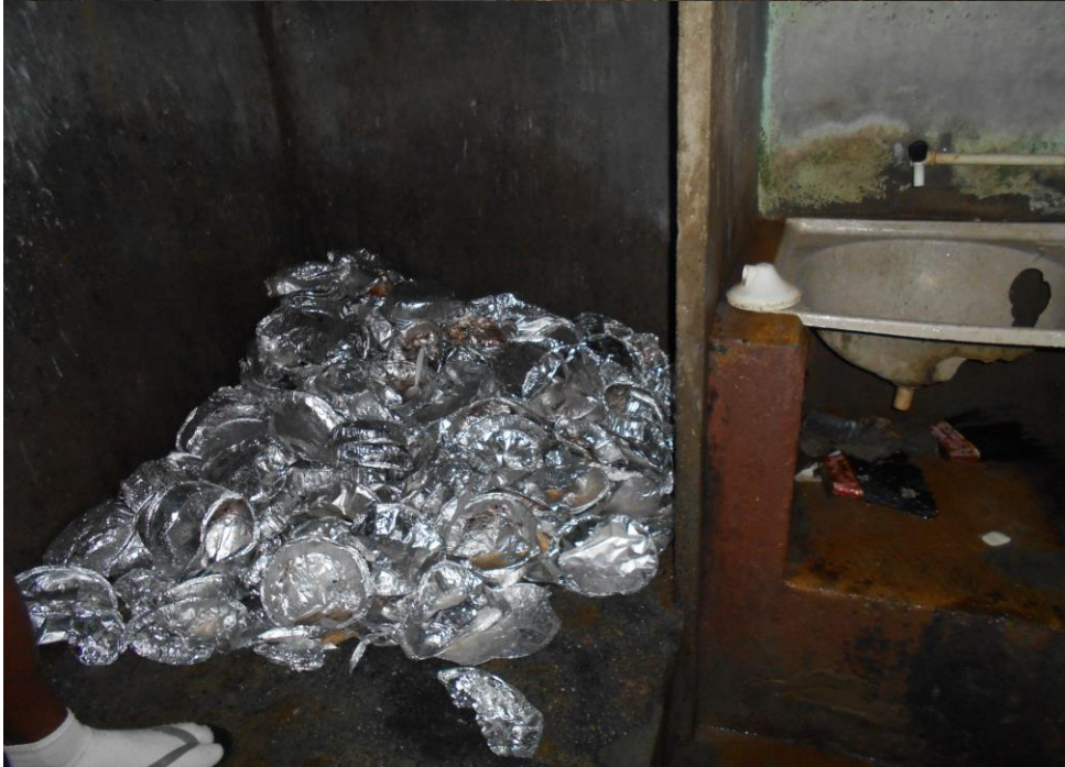
Lixo acumulado de restos de alimentos no banheiro das celas