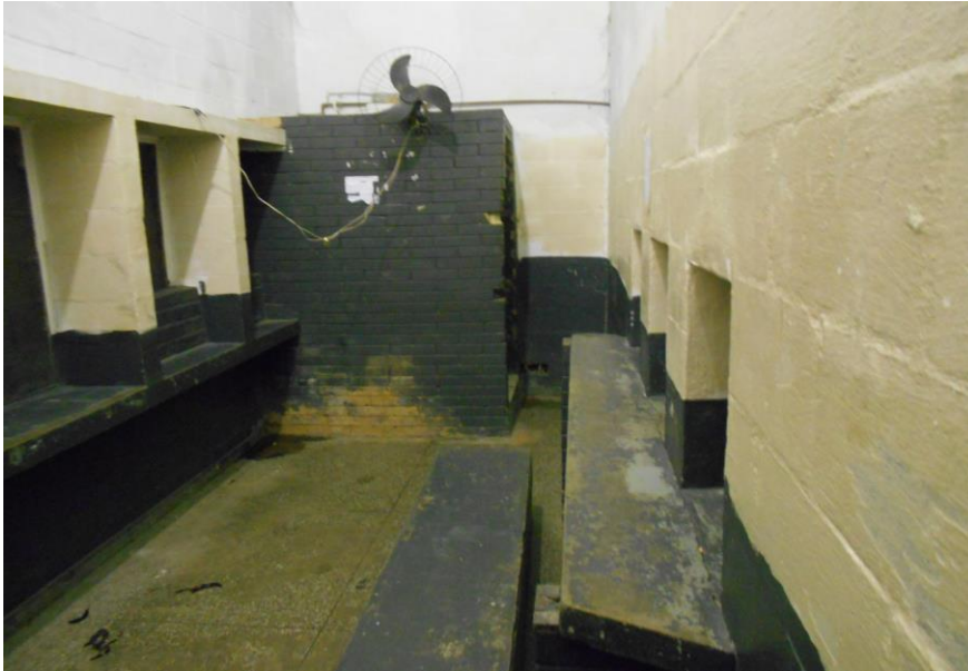
Parlatório utilizado para conversas entre os internos e seus advogados.