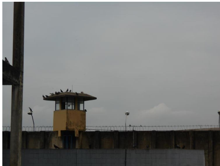
Vista lateral do Presídio Elizabeth Sá Rego.

O Presídio Elizabeth Sá Rego encontra-se no Complexo Penitenciário de Bangu. Há uma cancela principal, guardada por agentes do SOE, onde apresentamos nossas identificações e tivemos nossa entrada autorizada. Ao chegarmos a frente ao Presídio vistoriado, avistamos um grande portão de ferro, com uma guarita em cima, e a esquerda do portão, um espaço coberto com bancos e um beco com alguns carros estacionados.