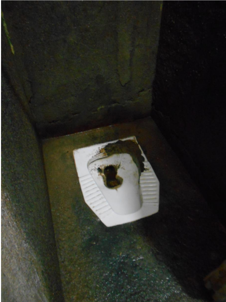
Estado de um dos bois presentes nos banheiros coletivos das celas