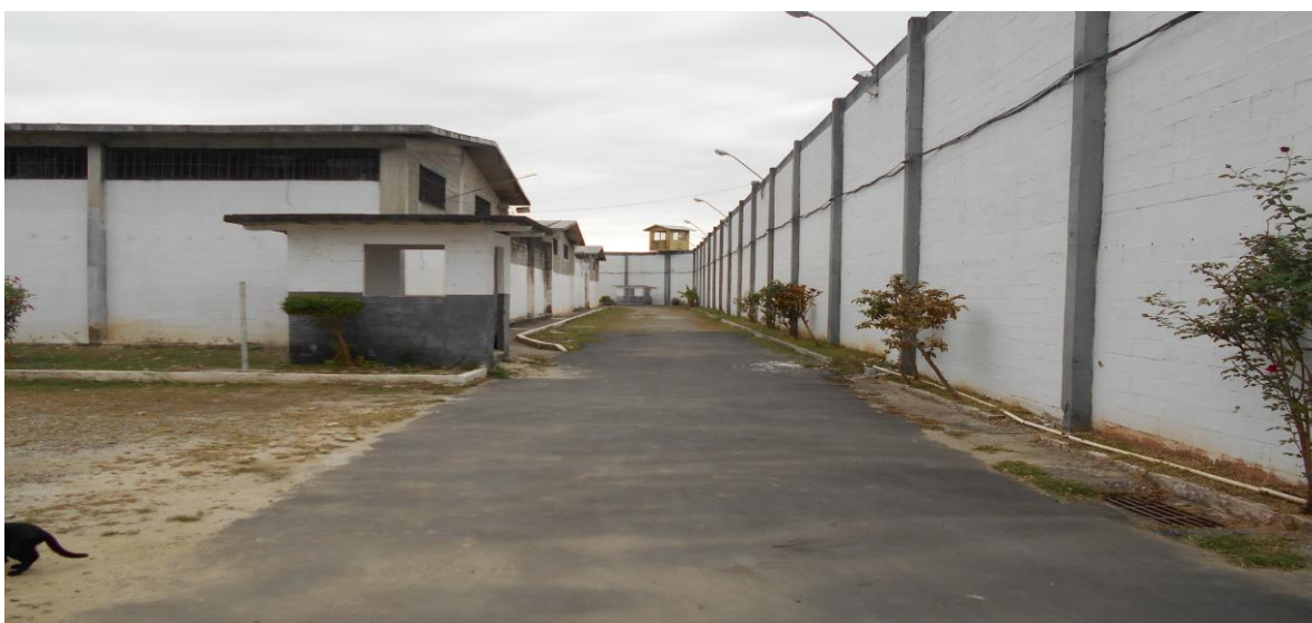
Visão da área ao redor da galeria principal da Unidade (.2)

Em geral, o aspecto externo da unidade e as áreas administrativas e que servem aos servidores são regulares, conforme adentra-se a Unidade, as condições físicas pioram, com grande quantidade de infiltrações, insalubridade e ambientes danificados pela falta de manutenção.