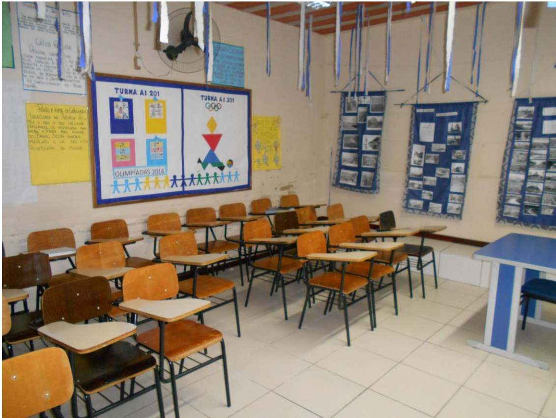
Sala de aula do Colégio Estadual

Para os internos que desejam trabalhar, só existem duas opções: serviços gerais (“faxina”) ou reciclagem. Atualmente apenas 25 detentos exercem a atividade de serviços gerais. A direção informa que os presos “faxinas” recebem salário e os que trabalham na reciclagem realizam trabalho não remunerado. O dinheiro ganho na reciclagem é utilizado para melhorias no presídio.