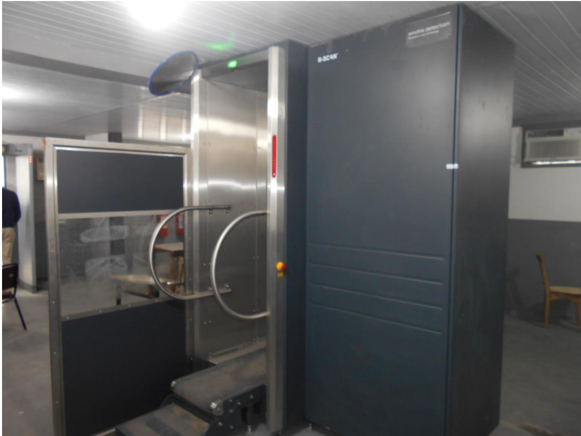
Scanner corporal da unidade.

de monitoramento com o recém-instalado scanner corporal e um banheiro; e no andar de cima fica o setor administrativo, o alojamento e refeitórios dos servidores.