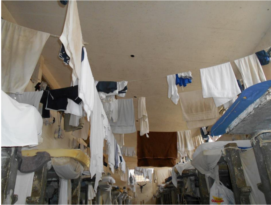
Uma das celas coletivas do Presídio Elizabeth Sá Rego.