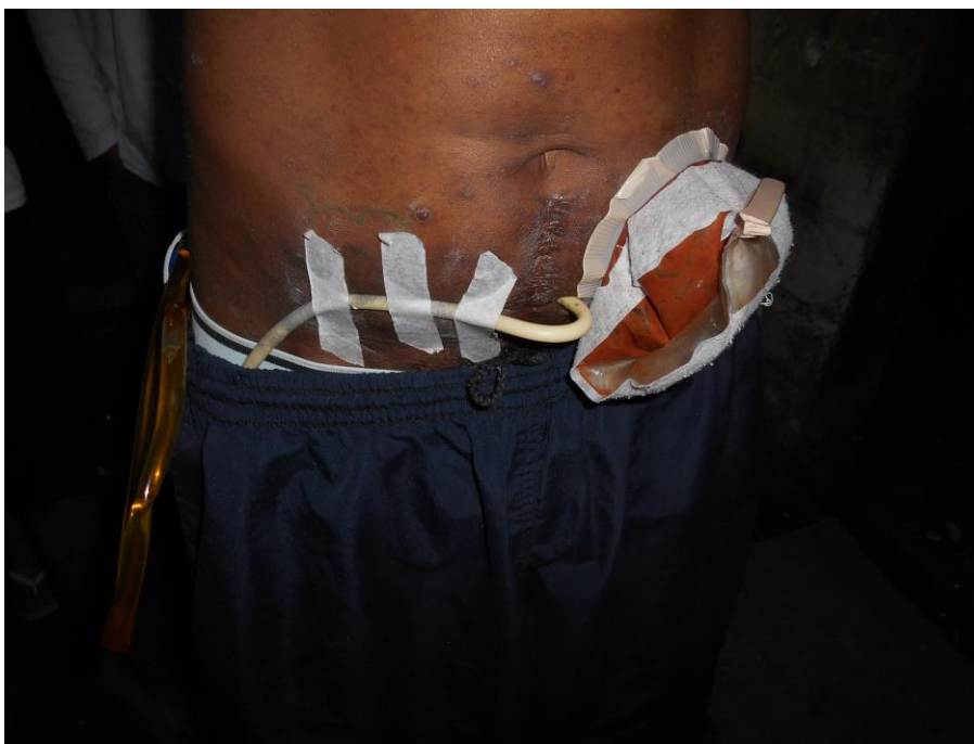
Preso com bolsa de colostomia.

Esta deficiência na assistência médica foi relatada pelos presos, com mais reflexos na saúde de alguns deles que estão em condições mais vulneráveis, conforme fotos abaixo.