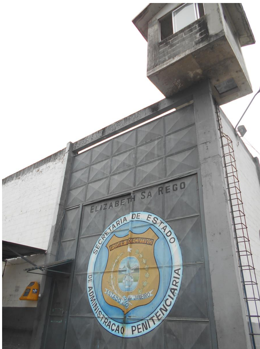
Portão de Entrada do Presídio Elizabeth Sá Rego.