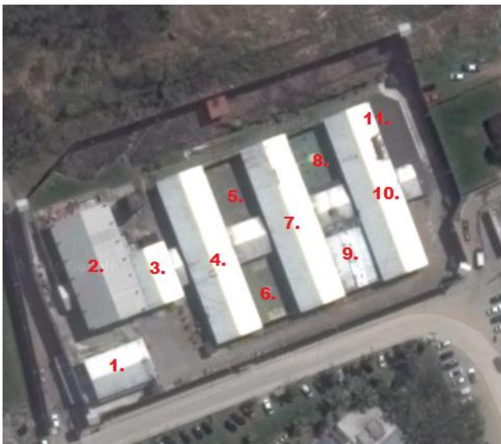
Imagem via satélite da unidade.

setores administrativos, refeitório e alojamento dos servidores, e à frente um largo corredor que termina em outro portão de ferro que dá acesso ao restante da Unidade, inclusive o edifício principal, onde ficam os internos. Na foto abaixo, retirada da ferramenta Google Earth 1 , consegue-se entender melhor esta estrutura; os números indicados aparecerão na descrição deste tópico.