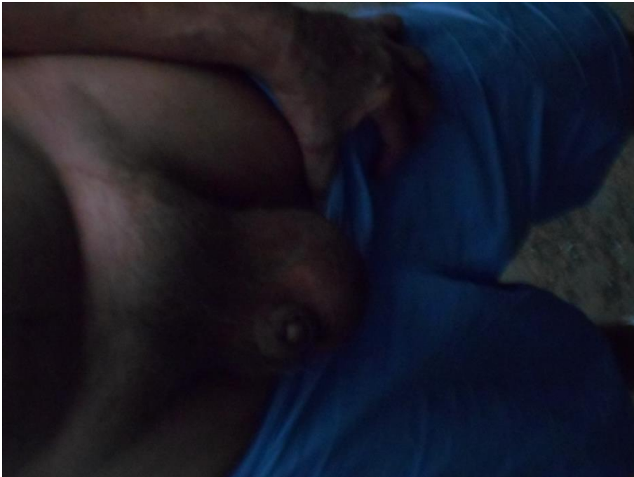
Preso com hérnia no saco escrotal.