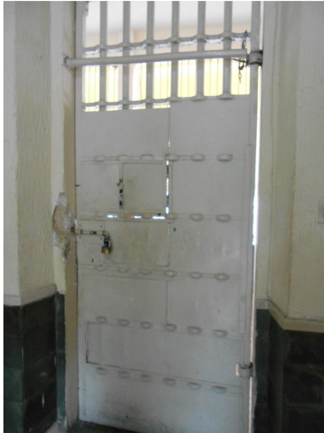
Foto 4. Portão de aço que separa a parte administrativa das celas.

que separa a área administrativa da área de acautelamento e a "quadra" na qual ocorre o banho de sol.