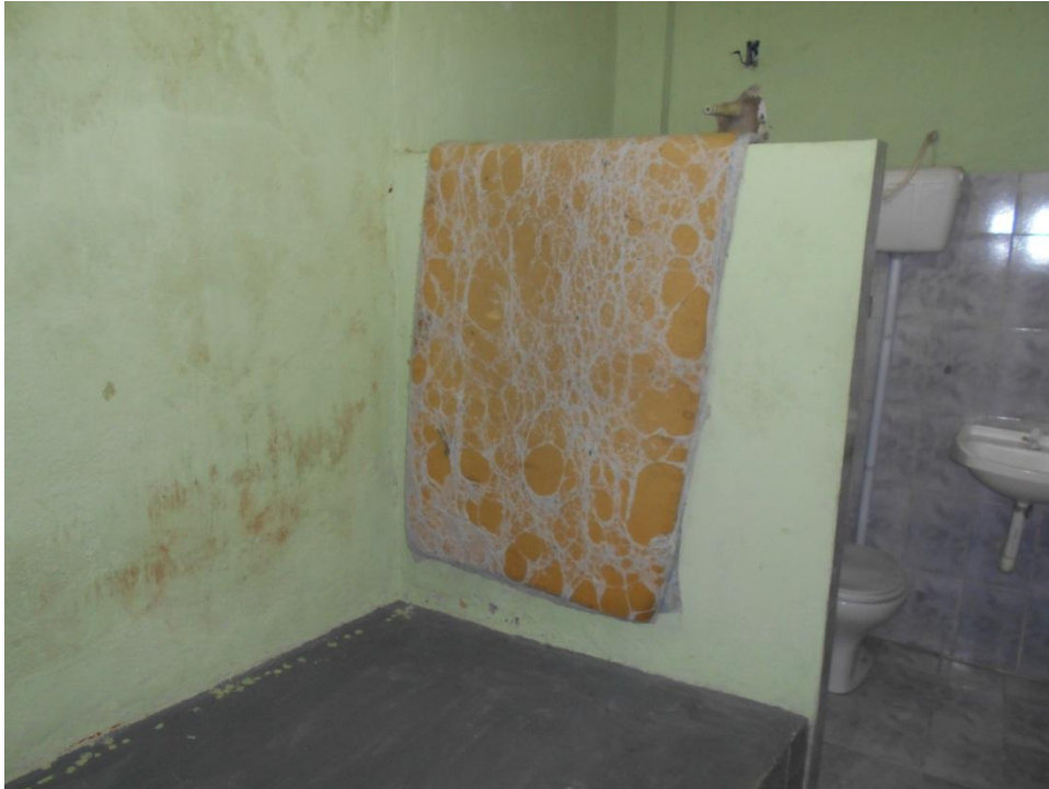
Foto 11. Parede suja, um fiapo de colchão e a comarca de cimento.

Ao lado das celas para cumprimento de pena em regime aberto, fica o parlatório de visita íntima, com apenas uma comarca de casal e um banheiro. Ambos em estado deplorável conforme fotos abaixo: