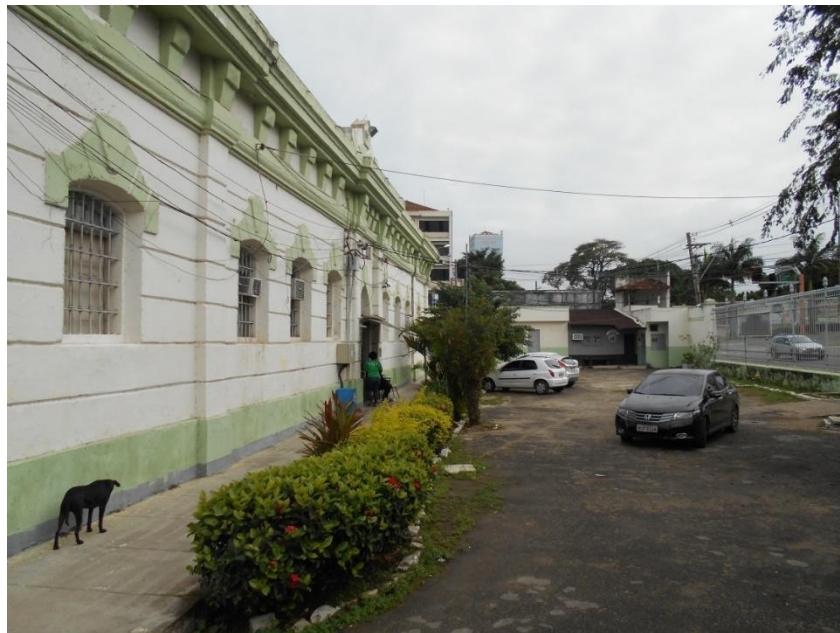
Foto 1. Ao fundo, interna com a blusa verde está na porta da unidade. À direita, percebe-se o quão próximo se está de uma das principais vias de Campos.

A unidade prisional Nilza da Silva Santos encontra-se em uma movimentada via da cidade de Campos dos Goytacazes, a saber, a Av. Quinze de Novembro, que em sua extensão conta também com um Shopping e com o Fórum local. Do seu interior, inclusive das celas, há visão para a rua e para os prédios vizinhos.