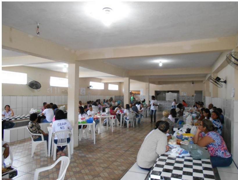
Foto 22. Pátio num dia comum de visita.

A visita íntima ocorre nos mesmos dias e horários, porém quinzenalmente. Apenas 4 internas usufruem do direito à visita íntima dentro da Unidade e 10 em presídios masculinos.