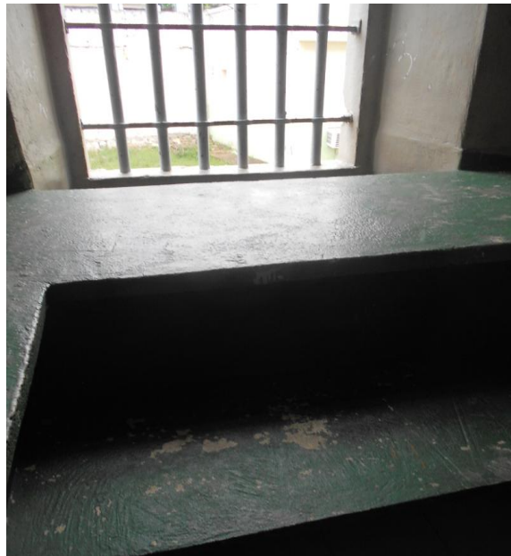
Foto 7. Comarcas de cimento puro. Esta imagem foi tirada da própria porta da cela, demonstrando o quão pequeno é o espaço.