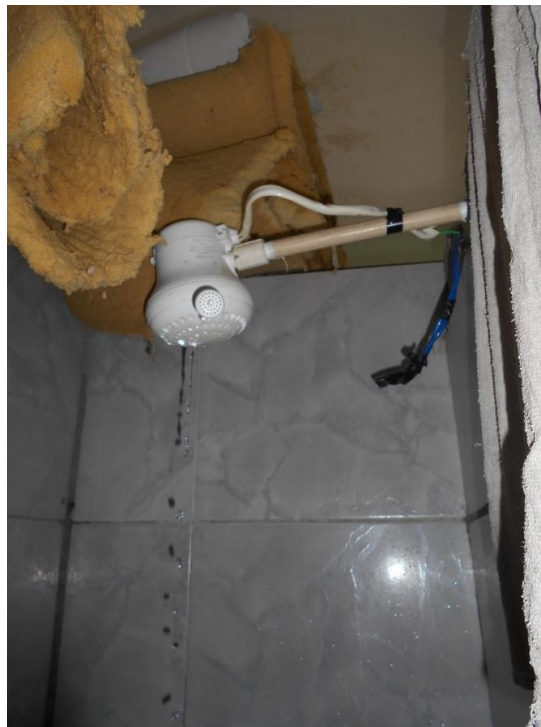
Foto 17. Chuveiro elétrico, com fios soltos e encapados por fita isolante, muito próximos à saída d'água.