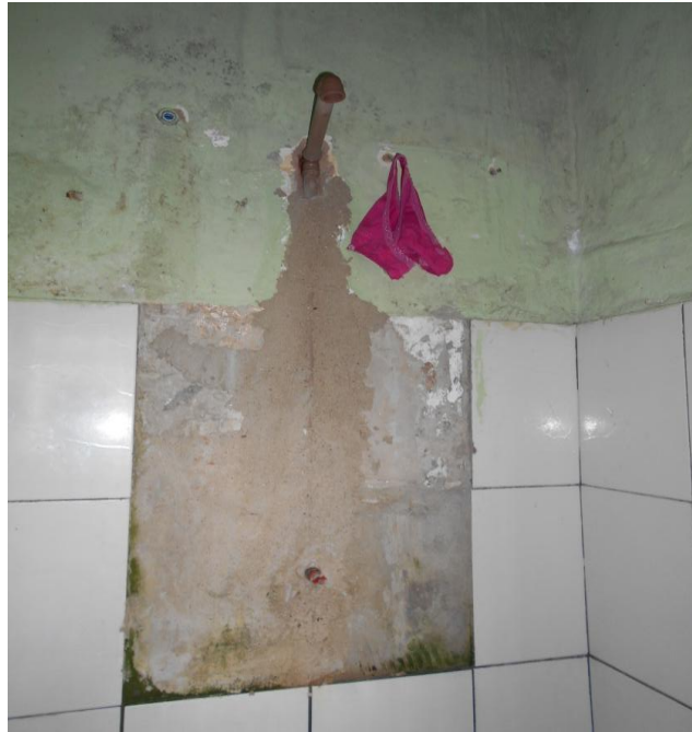
Foto 8. Cano conduzindo água à cela de isolamento. Apesar de funcionar, o aspecto de desgaste é evidente.