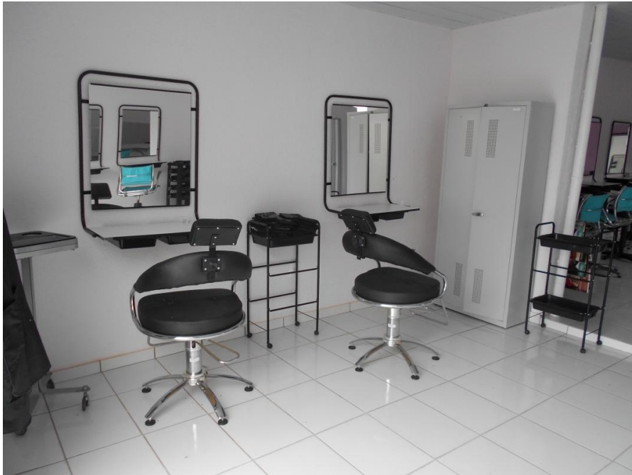
Foto 21. Foto tirada por fora do salão. Equipamentos e sala completamente novos.

Há um centro de beleza que apesar de recentemente inaugurado (2015) na data da visita não estava funcionando. Segundo a direção ainda esse ano (2016) será oferecido curso de cabelereira neste espaço.