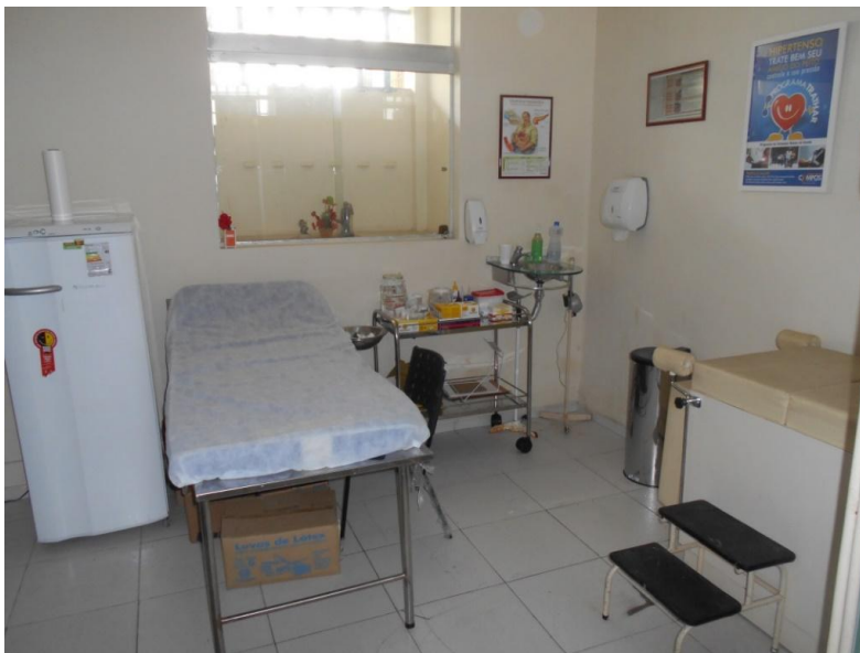
Foto 19. Consultório médico.