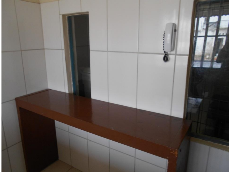
Foto 20. Parlatório completamente precário oferecido para advogados.

atendimento. Não há privacidade, já que o local é observável pela administração, o que desrespeita o disposto no artigo 41, IX da Lei de Execuções Penais 4 .