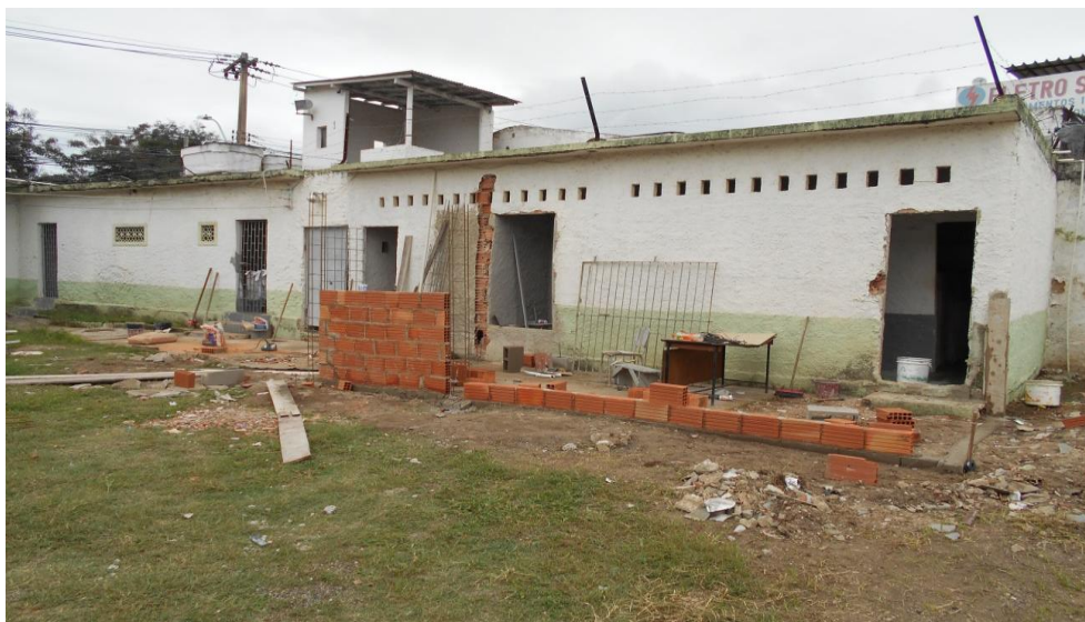
Foto 09. Obra para ampliar a capacidade do cumprimento de pena em regime aberto.

No momento em que a vistoria era feita, apenas uma interna que cumpre pena neste regime estava na cela.