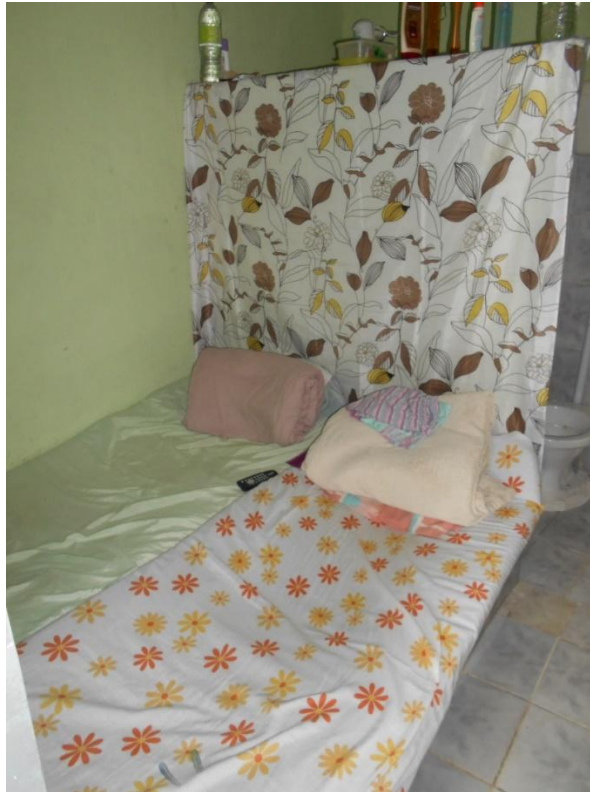
Foto 10. Interior de uma das celas ornamentado e organizado pelas próprias internas.