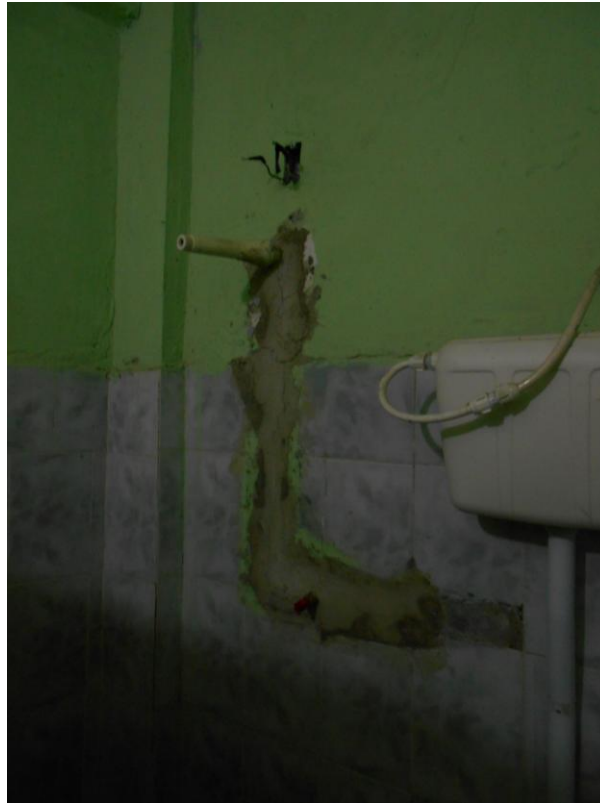
Foto 12 .Chuveiro do parlatório de visitas íntimas.