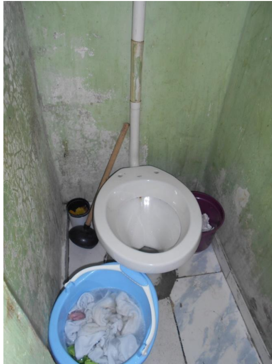
Foto 16. Vaso da unidade, sem a tampa e assento. Balde cm roupas de molho.