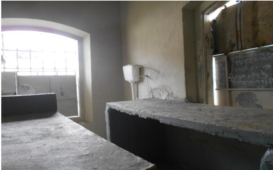
Foto 6. Comarcas de cimento puro e, no detalhe, uma caixa de descarga.