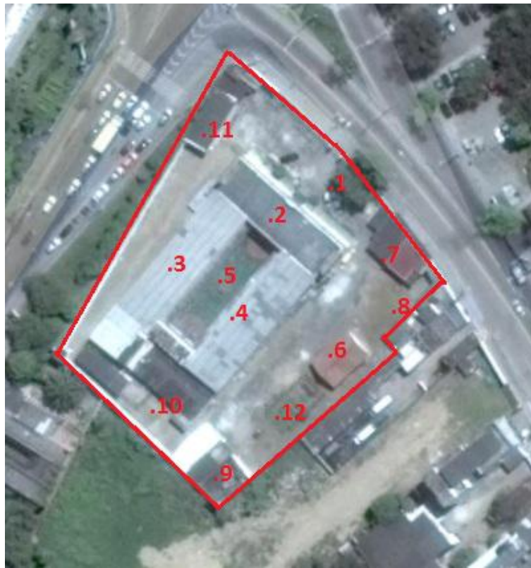
Foto 2. Imagem via Google Earth do presídio.

Durante o relatório, fotos e descrições mais detalhadas irão demonstrar cada parte da unidade. Abaixo, uma visão panorâmica do terreno onde se localiza o presídio Nilza da Silva Santos.