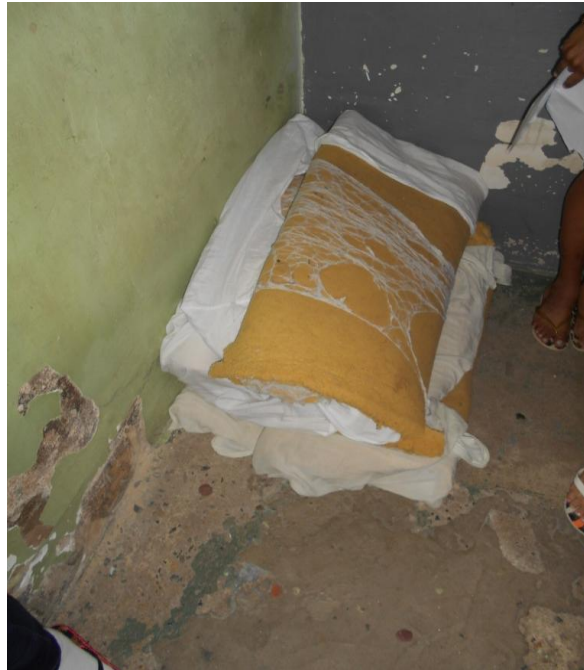
Foto 15 mais um exemplo de colchão em péssimo estado.

Foto 14. Detentas que não tem camas simulam como dormem, já que não há vagas suficientes.