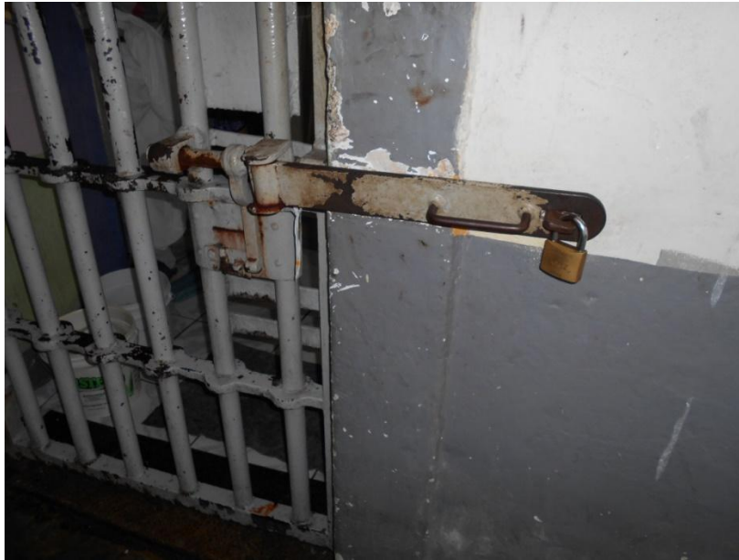
Foto 13. Cadeado comum e porta de ferro comum às celas.

Todas as celas estão superlotadas o que transforma o mero ato de dormir um desafio.