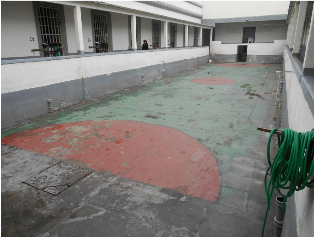
Foto 5. Quadra da unidade na qual ocorre o banho de sol. À esquerda, parte das celas.