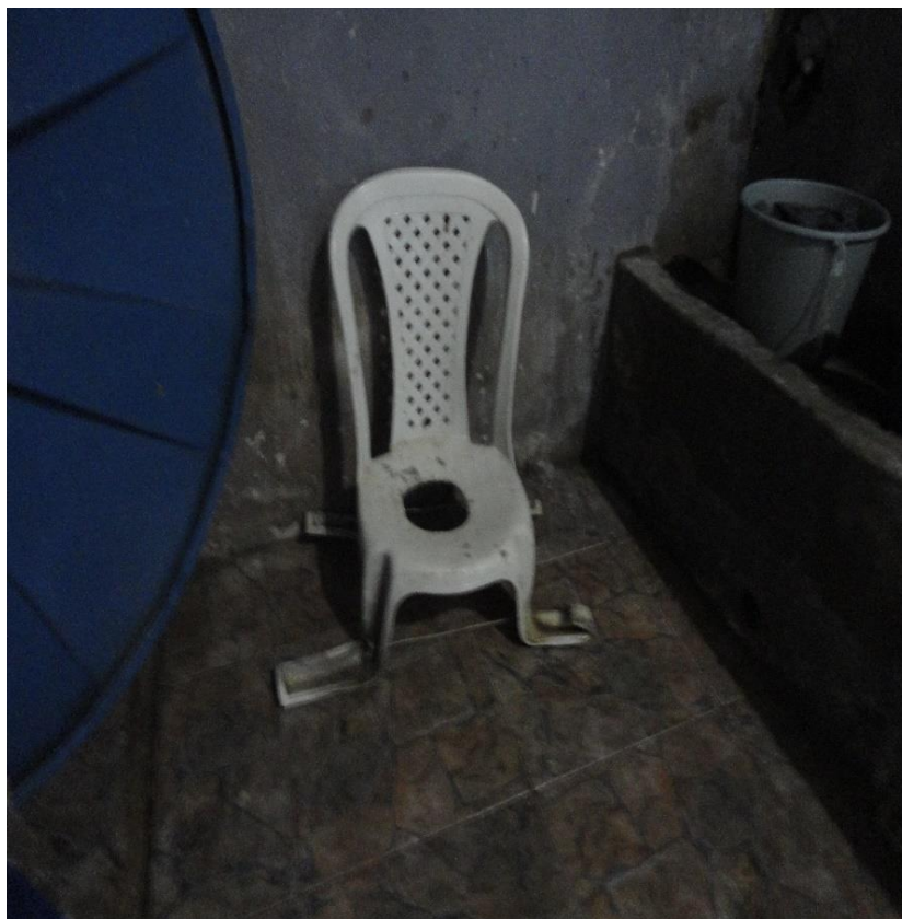
Cadeira plástica "adaptada" para os presos cadeirantes.

No entanto, a cela não possui adaptações adequadas para presos com deficiência , o que descumpra as determinações da NBR-9050. Havia apenas 1 (uma) cadeira de rodas para locomoção de presos com deficiência. A imagem abaixo ilustra a irregular situação dos presos, que tem que se desdobrar para garantir acessibilidade.