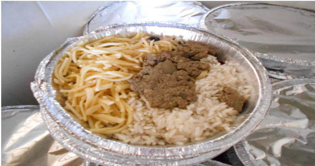
Alimentação dos presos