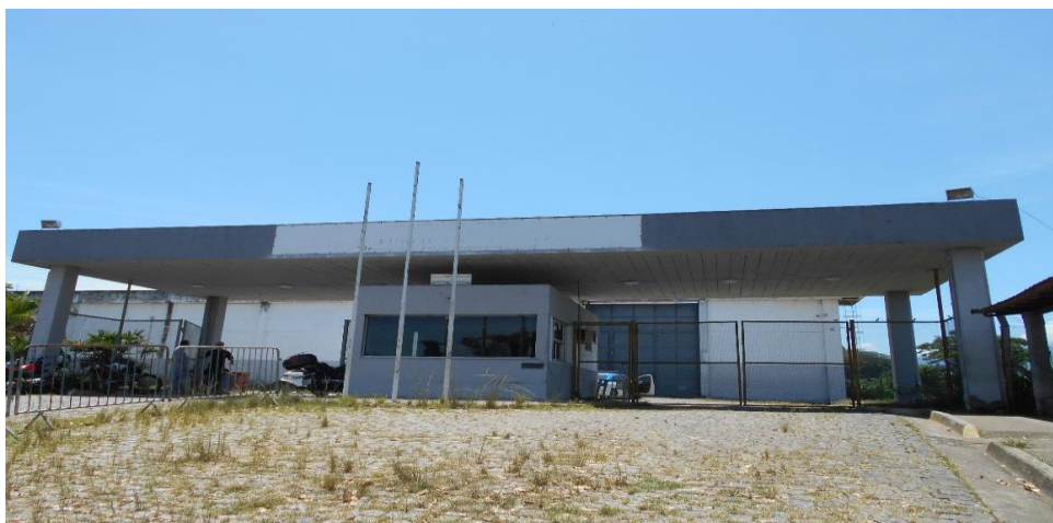
Portão de entrada da unidade

aguardarem. A entrada da unidade está em estado razoável de conservação, assim como o espaço para acomodar os visitantes.