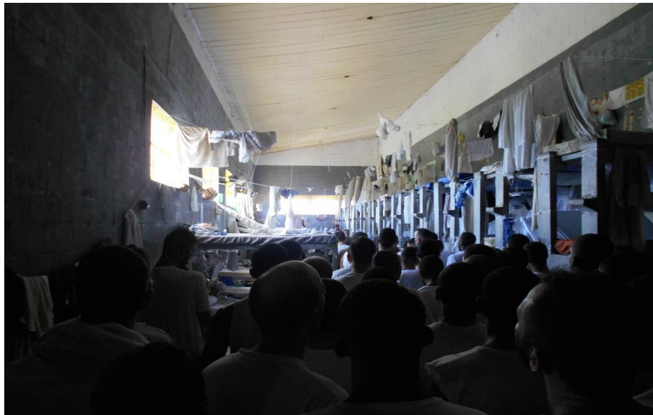
Cela em notável estado de superlotação.