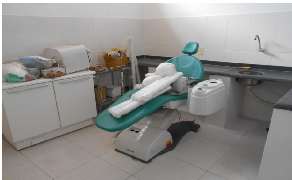
Consultório do dentista em condições de uso

O ambulatório é bem organizado e apresenta condições razoáveis de limpeza.