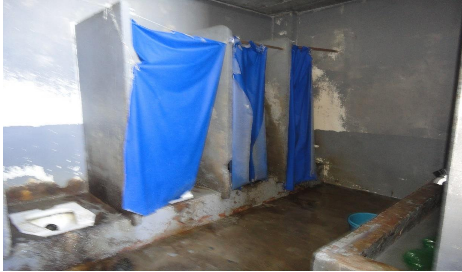
Banheiro com cortinas improvisadas. Do outro lado, o lavatório de concreto.