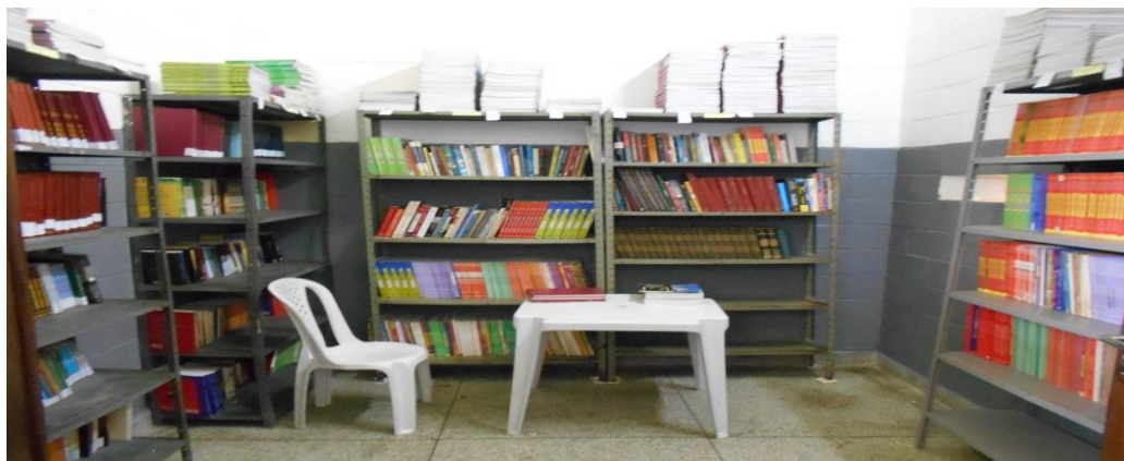
Sala de livros