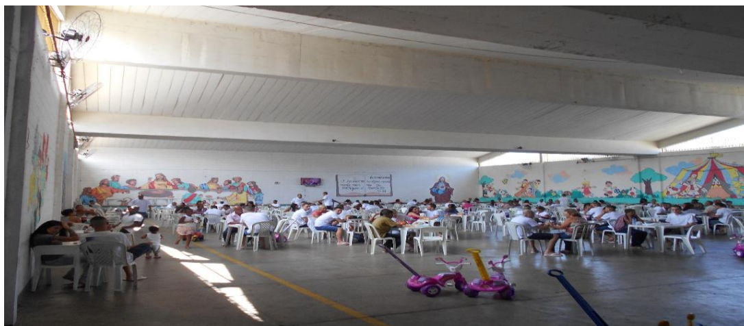
O espaço destinado aos encontros dos presos com seus visitantes.

As visitas íntimas ocorrem quinzenalmente em um parlatório com 9 (nove) cubículos que não pôde ser vistoriado porque estava ocupado no dia da vistoria.