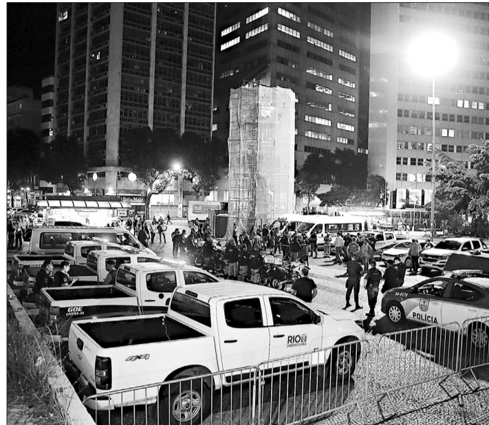
Cerca de 150 servidores participaram da operação na região central da cidade

Cerca de 150 servidores participaram do primeiro dia