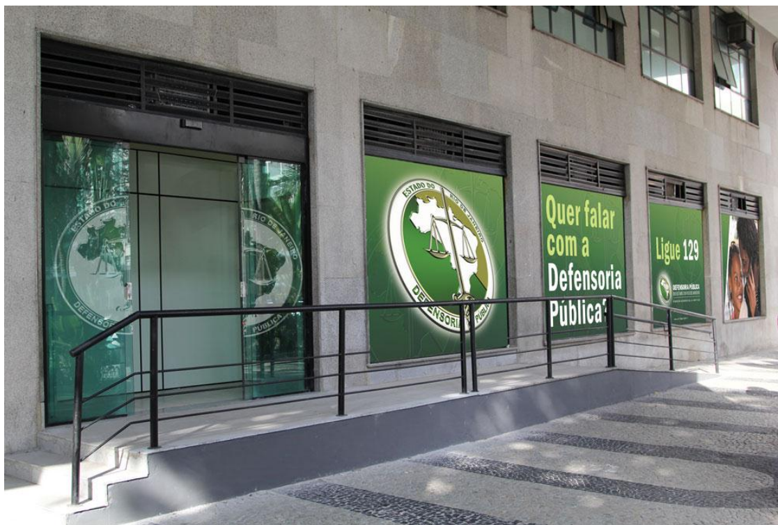
Figura 1: Painéis em adesivo, e adesivo jateado (à esquerda).