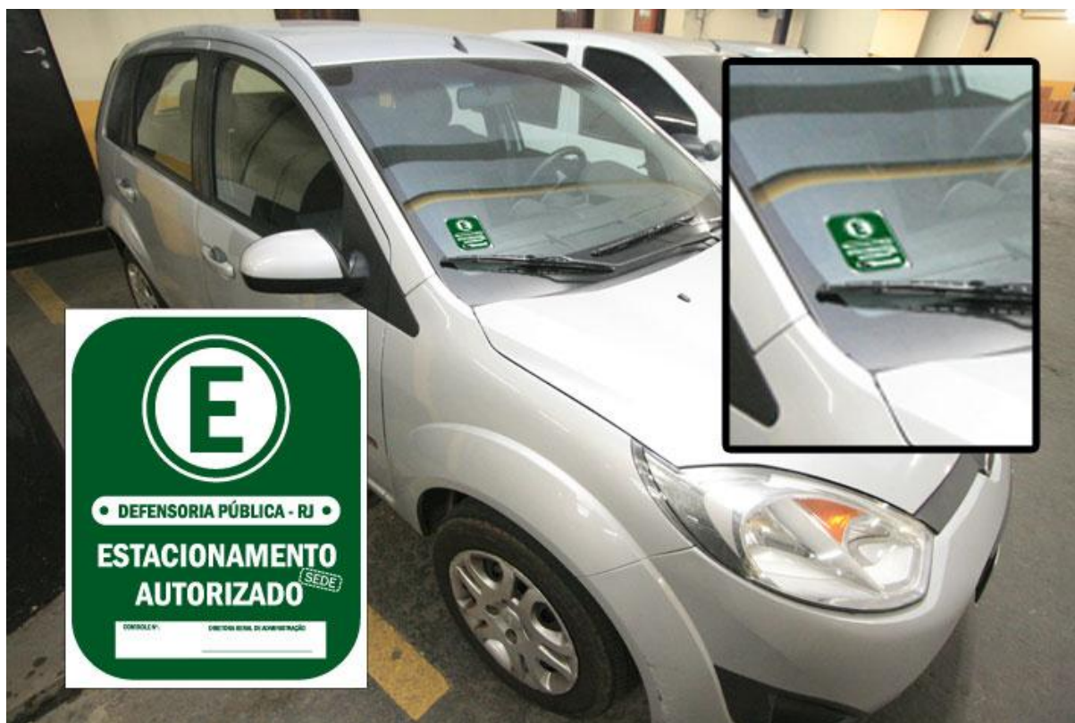
Figura 4: Adesivo para vidro de autos: retroverso e com laminação branca.