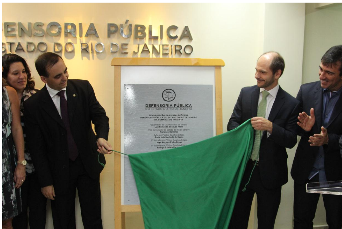
Figura 8: Letreiro Volumétrico e Placa de Inauguração