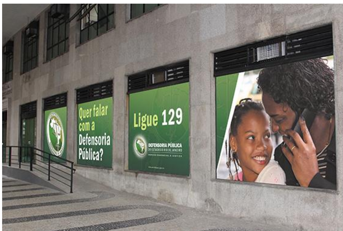
Figura 2: Painéis em adesivo.