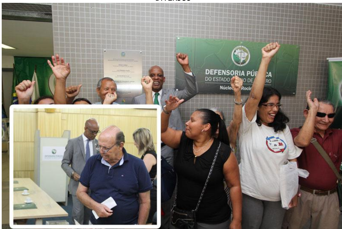
Figura 6: Na imagem ao fundo, adesivo em placa de acrílico. No detalhe, aplicação em divisória.