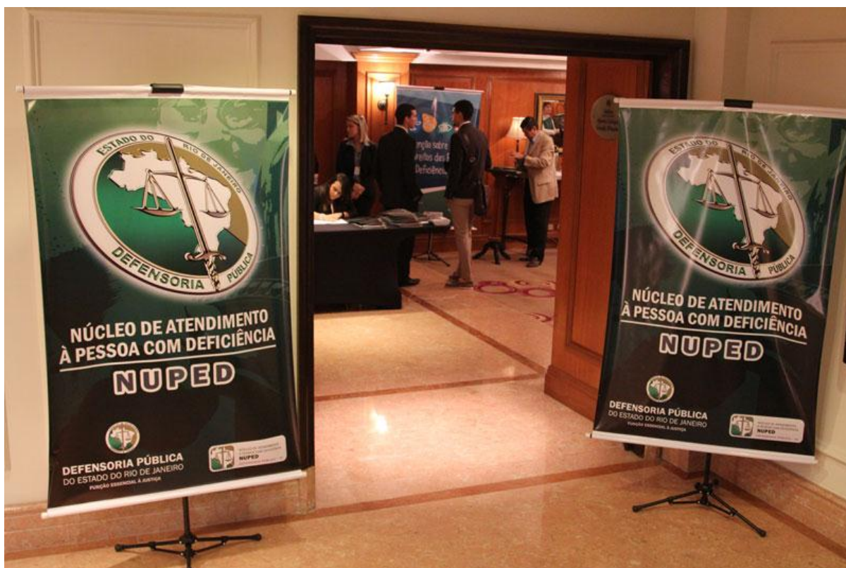
Figura 7: Banners padrão.