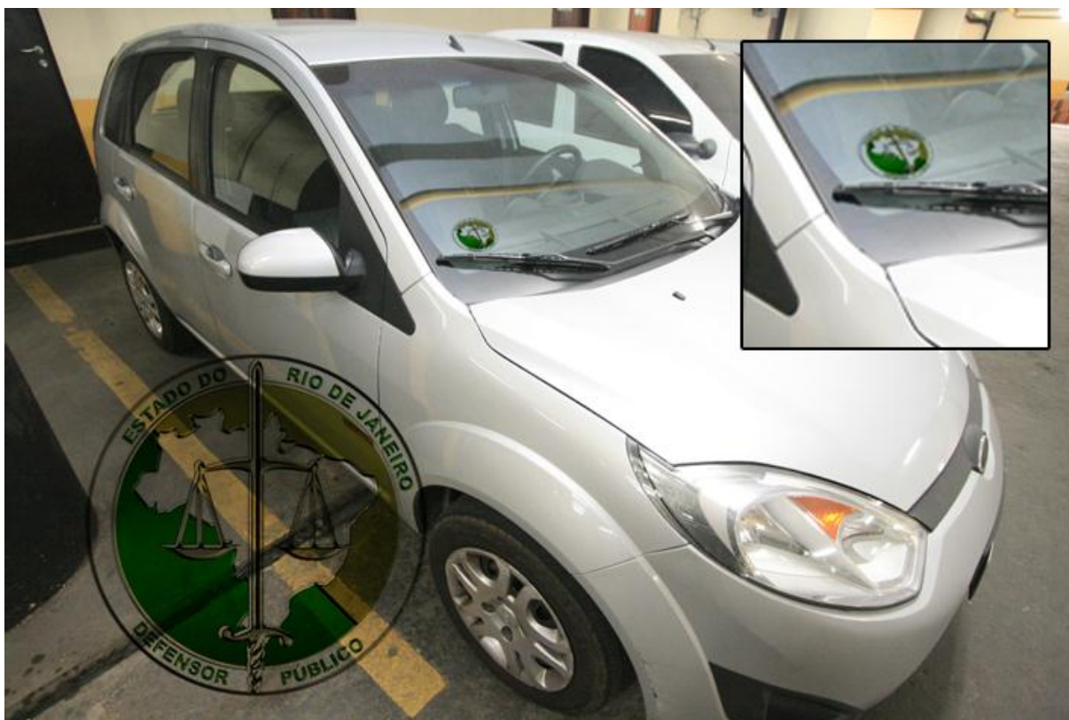
Figura 3: Adesivo para vidro de autos, retroverso.